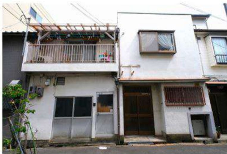
なかみちよんの隠れ家